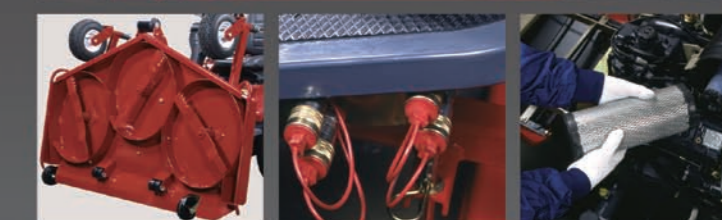
Verticaal te stellen maaidek 2 dubbelwerkende ventielen 4 snelkoppelingen Binnen- en buiten luchtfilter