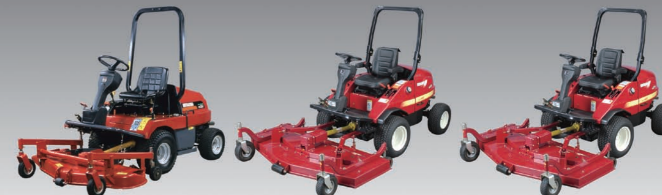
CM214 24 pk/ (17,6 kW)

De Shibaura motoren zijn ideaal wat betreft makkelijk onderhoud. Aan één kant van de motor kan het oliepeil gecontroleerd worden, het oliefilter vervangen worden en al het andere onderhoud worden gedaan.